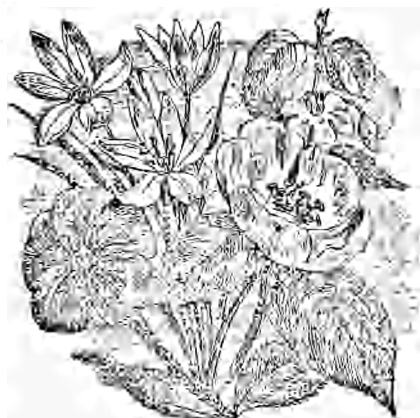
FLEURS DE LA TERRE-SAINTE.