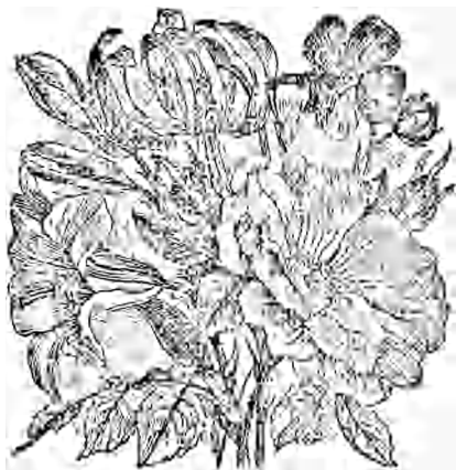
LIS ROUGE. LIN. LIS BLANC. ROSE. FLEURS DE LA TERRE-SAINTE.