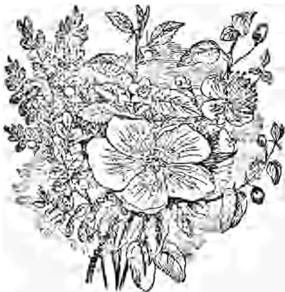
FLEURS DE LA TERRE-SAINTE.