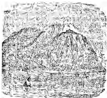
LE MONT CARMEL.