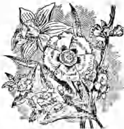
FLEURS DE LA TERRE-SAINTE.