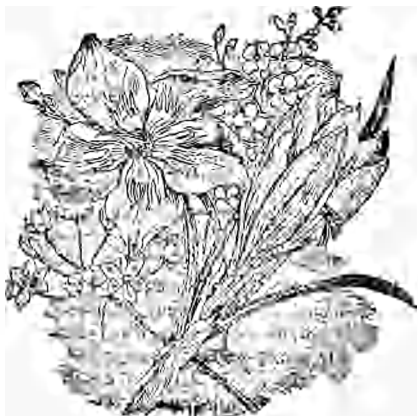
FLEURS DE LA TERRE-SAÏNTE.